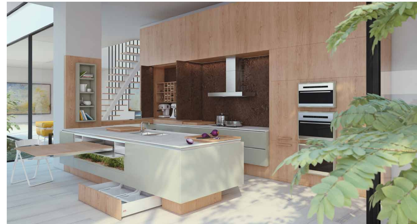
דגם ART עם שולחן אוכל נשלף, הכיסאות מאוחסנים בצוקל