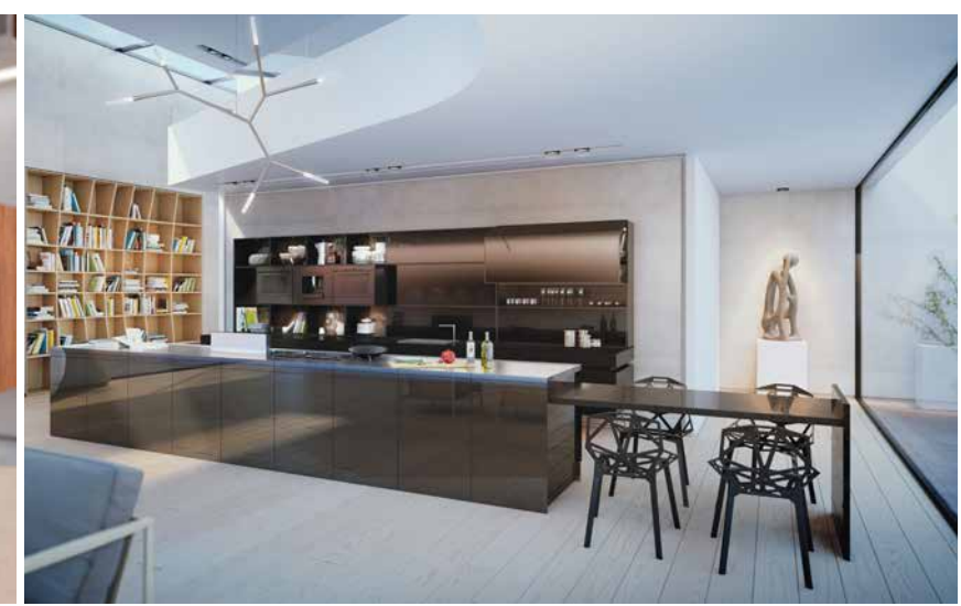
דגם NOIR בו כל מכשירי החשמל מאוחסנים בתוך הארונות, שולחן צד נשלף משמאל: מגירה בקבוקים נשלפת מדופן הצדדי של האי