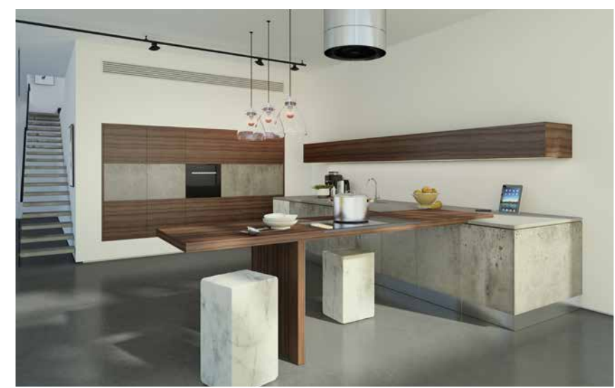
דגם TONE דלתות בציפוי בטון בלעדי לאביבי

SMART KITCHEN הוא המותג שאותו פיתחה חברת 'אביבי' כקונספט חדש וייחודי, נוכח העובדה כי הישראלים אוהבים מאוד לארח ולבשל בבית. המטבח הישראלי מהווה ציר מרכזי בהווי חיי המשפחה בישראל, ולפיכך הוא גם גורם מאוד משמעותי בעיצוב הבית, במיוחד בשנים האחרונות אשר בהן המטבח הפך לחלק בלתי נפרד מהאזור החברתי. במטבח בארץ מבשלים, מארחים, מכינים שיעורים, אוכלים ארוחות חפוזות, ובקרוב משפחות רבות באמצע השבוע המשפחה מסבה יחד לארוחה משפחתית, לא רק בערב שבת ובחגים. מצד אחד הפעילות הרבה והמגוונת שמתקיימת במטבח מחייבת תכנון מדויק לאחסון, אם זה כלים, מוצרי מזון ומכשירי חשמל שונים, גדולים וקטנים, וכן יצירת משטחי עבודה נוחים וגדולים. מצד שני הפתיחות של המטבח לאזור החברתי מכתובה עיצוב מדוקדק שישתלב עם העיצוב הכללי של הבית. במקרים רבים כל הפונקציות האלה חייבות להיכלל בשטח לא גדול שלעיתים לא עולה על שלושה מטרים. בחברת 'אביבי' הבינו את מורכבות הנושא, והבנה זו הובילה אותם לפיתוח רעיון ה-SMART KITCHEN קולקציית מטבחים חכמים ופונקציונליים, בעיצוב עכשווי, המנצלת בצורה חכמה ודינמית שטח נתון. פתרונות העבודה והאחסון מותאמים באופן אישי לצורכי הלקוח מבלי לפגוע בתחושת המרחב והגודל גם כשמדובר בחללים קטנים. ■